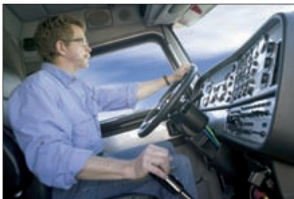
Регулярная очистка автокондиционера особенно актуальна для водителей-профессионалов.

Медики считают, что появление Legionella в автомобильной системе кондиционирования маловероятно. Но ведь грибков, бактерий,